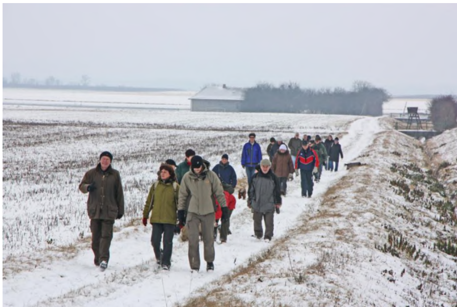
Wandertage in Feuersbrunn