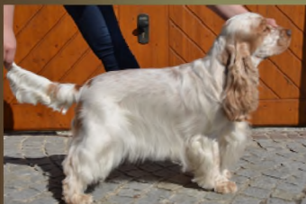
„Aries vom Schloss Ottenstein“