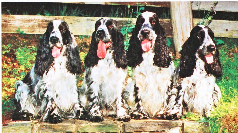
Stars and Stripes, seine Tochter Ginger Rogers, Mister Blue und dessen Tochter Royal Blue