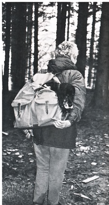
Ältere Herren sollten sich nicht überanstrengen

Zum 10. Mal waren wir diesmal zu Gast bei Fam. Dr. Kugler in deren schönem Domizil am Attersee. Bei schönem Wetter fanden sich wieder sehr viele Hundefreunde ein, um gemeinsam einen netten Tag zu verbringen. Hiermit möchte ich mich nochmals bei den Hausherren bestens bedanken für ihre außergewöhnliche Bereitschaft, nun schon 10 Jahre lang so vielen Leuten ihr Haus mit Garten und allem Drum und Dran zur Verfügung zu stellen. Es verursacht nicht nur Kosten, sondern macht auch immer viel Arbeit. "Danke schön!"