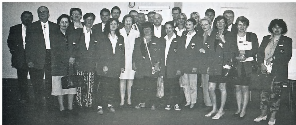
Welthundeausstellung am 6. 6. 1996