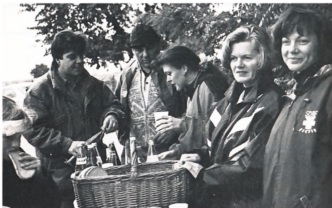
Bei der Labestation - Wandertag Mörbisch am 7. 9. 1996

Trockene gebracht und konnten sich im Winzerkeller bei Speis und Trank erholen. Großes Lob aber an die vielen Teilnehmer und deren Hunde, die sich trotz der miserablen äußeren Bedingungen spanielwohl fühlten und bestens ausgerüstet waren.