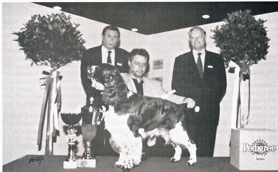
Sieger's Midnight Special, Weltsieger, BOB, BIG