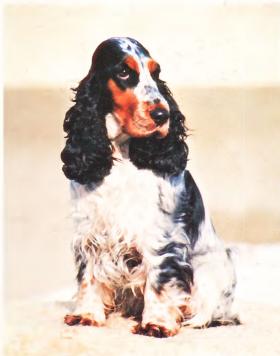
Ausstellungscup-Sieger 1996 (Cocker Spaniels) „Octopussy v. Österreichring“