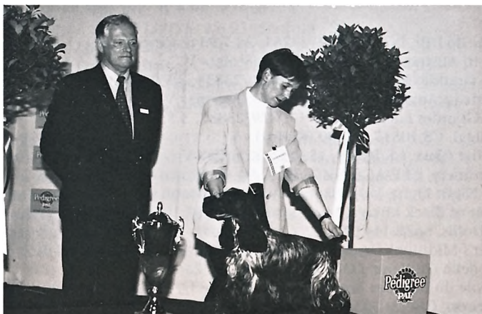
WHA Wien - BOB Cocker Jenia du Plateau des Chambles