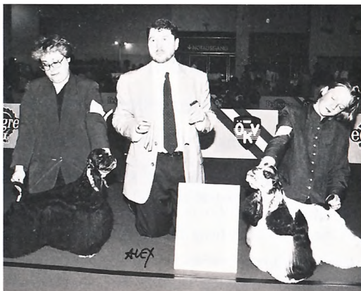
Welthundeausstellung Wien - BOB u. CACIB Am. Cocker