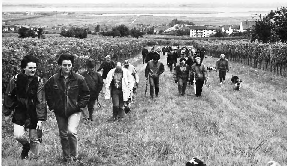
Wandertag der Landesgruppe Niederösterreich am 7. 9. 1996

Trotz aller gegenteiliger Prognosen sämtlicher anwesenden Wetterfrösche war es nicht zu verhindern, daß kurz vor Erreichen der zweiten Labestation, einer Jagdhütte, die Wanderung abgebrochen werden mußte. An dieser Stelle wird angemerkt, daß der Abbruch aber nur deshalb erfolgte, weil die Verköstigung der Hundebesitzer im Freien unzumutbar war. In einer Blitzaktion wurden alle ins