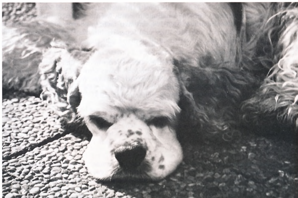
Die letzte Ausstellung - endlich geschafft!

615. Pansgrove Acacia Spot, ESS 1302, 25.8.93 (Cleavehill Kickstart - Doina from the Sliswood) Z: Meitzen B: Illenschitz. - Edle, sehr gut aufgebaute Hündin. Gut geschnittener Kopf, wünschte mir etwas mehr Hals. Gute Rückenlinie, gute Vorbrust und Brusttiefe. Front und Hinterhand korrekt, schlichtes Haarkleid, gut präsentiert, Bewegung genügt. V1, CACA