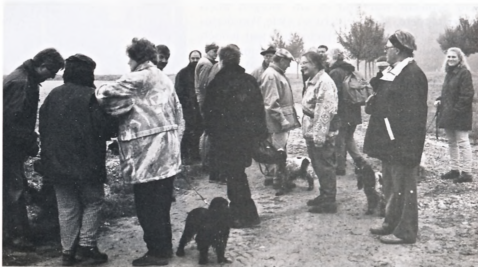
Wandertag der Landesgruppe Oberösterreich am 26. 10. 1996