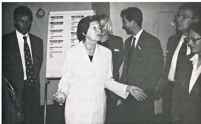
Welthundeausstellung am 6. 6. 1996