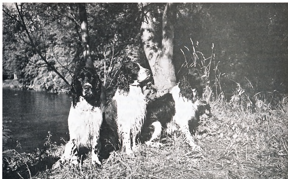
Nach der Wasserarbeit