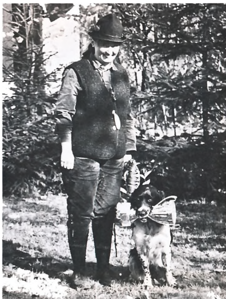
"Assi" ist mit ihrer Führerin Mitglied der Jagdhundestationen Leibnitz und Graz.

Bringtreueprüfung Irgl am Eck; Schweiß-SP Irgl am Eck 64 P., 1d-Preis; Verbandsschweißprüfung Kempterwald (D) 20-Stunden-Fährte 2. Preis; Schweiß-Sonderprüfung ohne Richterbegleitung St. Oswald o. E.; 4 Verweiserpunkte - Silberner Schweißriemen; VGfP Purkersdorf; 245 P., 2b-Preis; Schweißprüfung des ÖJGV, 62 P. 1c-Preis.