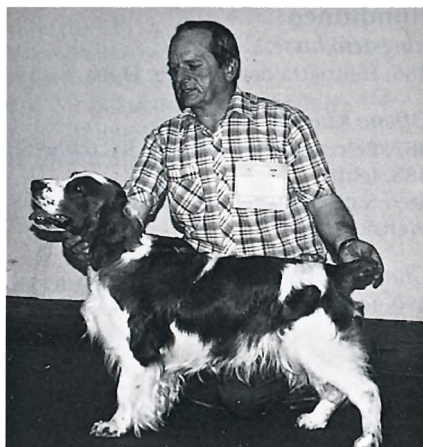
WSS - bester Rüde - Zorro Jifex

451. Don's Thessagon, S 12364/91 H, 3.12.90 (Eriksson) - SG