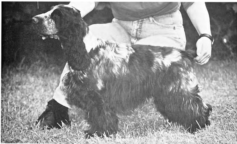
Sachmo v. Frenzer Feld - BOB Graz, Hausmannstätten

26. Mister Blue van Mondanou, CS 11082, 10. 6. 93 (Eye Catcher v. Mondanou - Nadine v. Mondanou) Z: Kleinjans B: Neumann/Doppelreiter. - Harmonischer Rüde, gut aufgebaut, sehr schöner Kopf, Scherengebiß, dunkles Auge, korrekter Behang, guter Hals, gerader Rücken. Gute Brusttiefe und -breite. Korrekte Läufe, gutes Haarkleid. Freie Bewegung, vorne etwas eng. V3