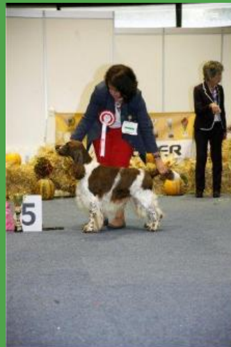
5. Platz English Springer Spaniel WINTERWATER CREEK'S GREAT BRITAIN MADE HÜBLER EVA-MARIA