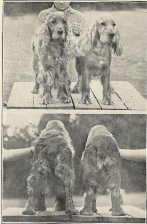
Auf beiden obigen Bildern ist links die ungetrimmte Hündin und rechts der zurecht gemacht Rüde.

Die Federn an den Vorderläufen müssen vorsichtig getrimmt werden, so daß keine langen Haare stehen bleiben weder an der Vorderseite der Vorderläufe, noch an den Schultern. Ersteres würde den Eindruck von Pfauentauben-Füßen hervor-