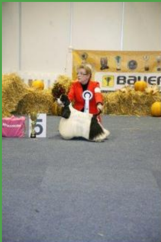
5. Platz American Cocker Spaniel ROYALTY INC BEAT IT EITEL V. + R. + C.