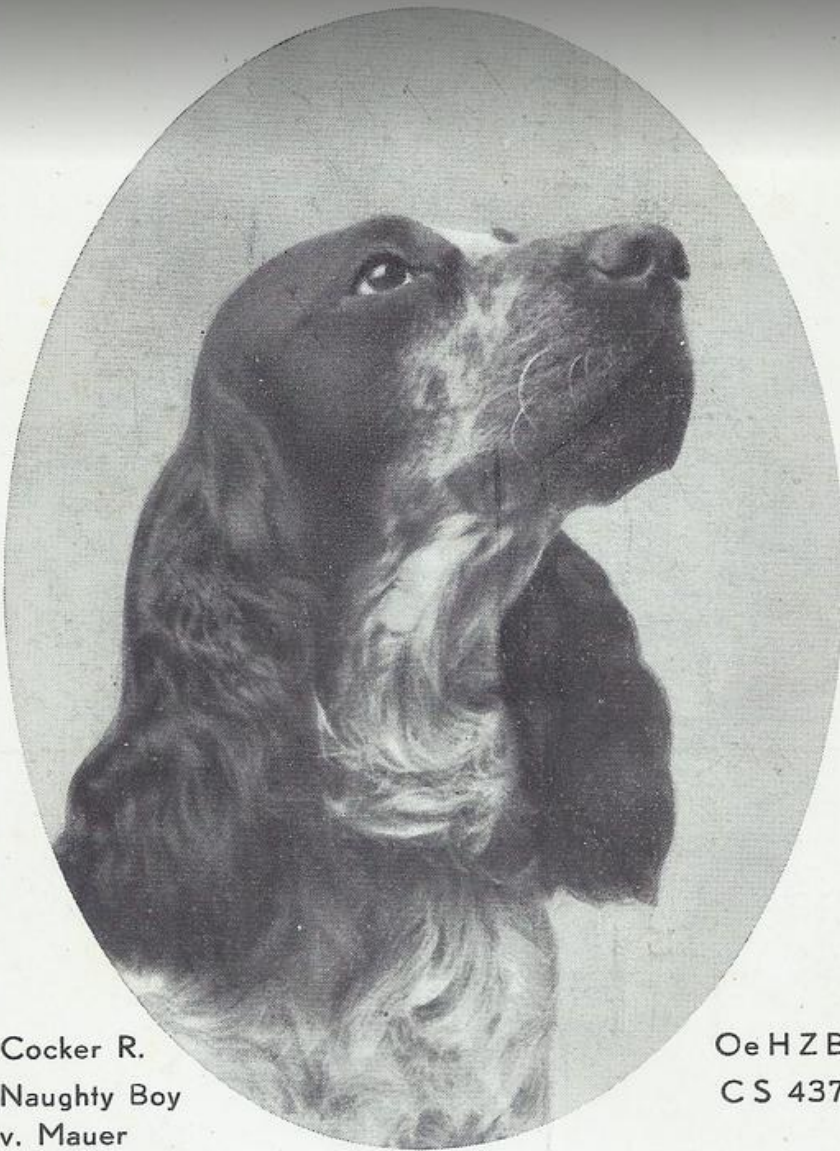
Cocker R. Naughty Boy v. Mauer