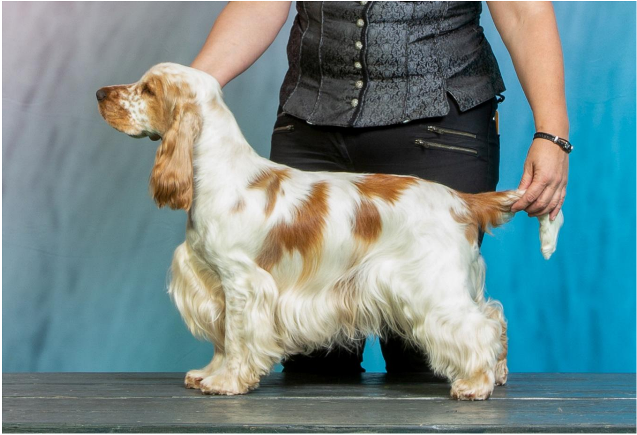
Jump'N Smile Knoxville Girl